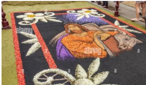
Catifes de quadres de pintura o altres imatges que es reproduïxen