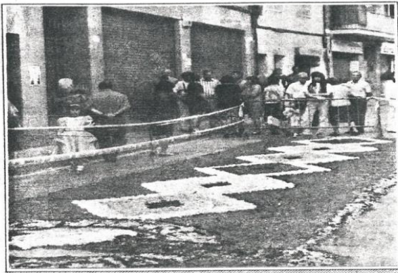
Se tardó unas seis horas en confeccionar las alfombras LUTOPRI