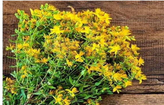
flor de Sant Joan