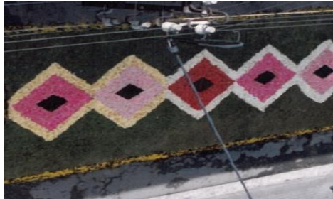
Catifes de sanefes