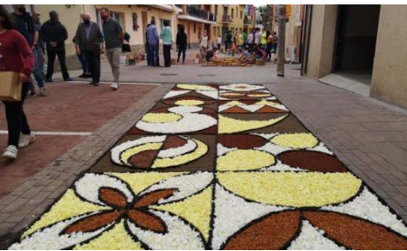
Catifes d'estil neutre