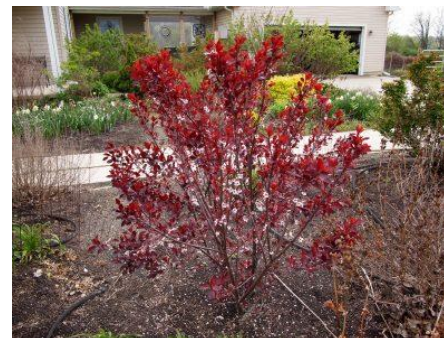
branques i fulls d'arbustos