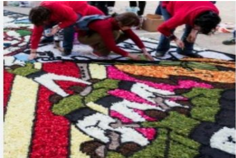
Catifes elements culturals