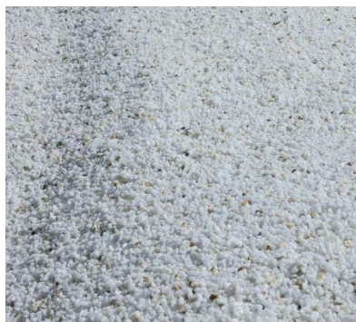
pedres de marbre