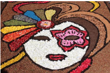
Catifes d'elements simbòlics