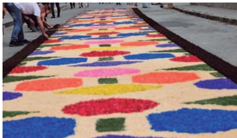
Catifes amb elements grans i geomètrics