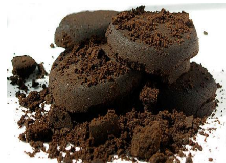
marro de cafè